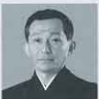
二十六世観世宗家 KANZE KIYOKAZU 観世清和

1959年生まれ 二十五世観世左近正三長男 重要無形文化財総合指定保持者 平成27年春、勅選能楽師 芸術文化庁文化庁長官賞 芸術文化庁文化庁長官賞 フロンティア文化財奨励シヨウリ工受章 (一)財団法人 理事長 (二)財団法人 理事長 (三)財団法人 理事長 (四)財団法人 理事長 (五)財団法人 理事長 (六)財団法人 理事長 (七)財団法人 理事長 (八)財団法人 理事長 (九)財団法人 理事長 (十)財団法人 理事長 (十一)財団法人 理事長 (十二)財団法人 理事長 (十三)財団法人 理事長 (十四)財団法人 理事長 (十五)財団法人 理事長 (十六)財団法人 理事長 (十七)財団法人 理事長 (十八)財団法人 理事長 (十九)財団法人 理事長 (二十)財団法人 理事長